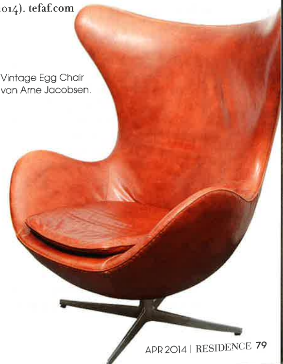
Vintage Egg Chair van Arne Jacobsen.