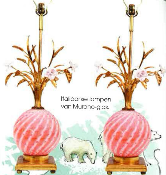
Italiaanse lampen van Murano-glas.