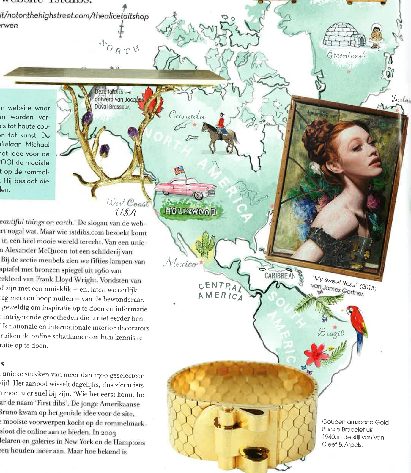
Deze tafel is een ontwerp van Jacques Duval-Brasseur.